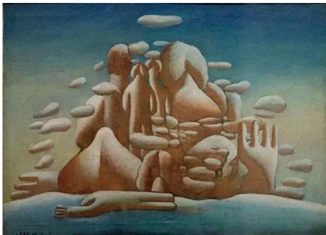
Рисунок 2. Ван Гуанъи. «Замёрзший Северный полюс». 25. X., м. 80x100 см. 1985. Частная коллекция.