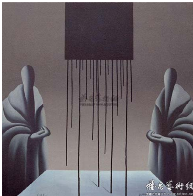
Рисунок 8. Ван Гуанъи. «Евангелие от Матфея». Х., м. 99x99 см. 1986. Частная коллекция.

В то же время Ван Гуанъи наполняет сюжет новыми смыслами, смыкая христианский образ с супрематистским чёрным квадратом. Письменное свидетельство о земной жизни, учении Христа, оставленное Матфеем, подчёркнуто гипертрофированной рукой, условно держащей Евангелие. Элементы формы, ахроматическая тональность картины напоминают другие работы серии, но с точки зрения психологического воздействия чёрный квадрат, написанный в верхней части полотна с чёрными потоками, создаёт подавляющий эффект скорби и печали. Ван Гуанъи