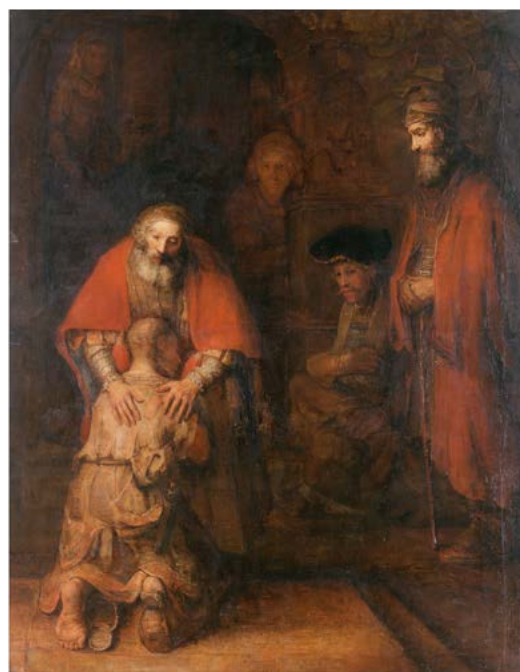
Рисунок 5. Рембрандт Харменс ван Рейн. «Возвращение блудного сына». Х., м. 205x262 см. 1669. Государственный Эрмитаж.