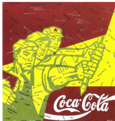
Рисунок 10. Ван Гуанъи. «Великий критицизм – Кока-кола». Х., м. 200x200 см. 1993. Частная коллекция.

Критики назвали серию «Великий критицизм» политическим поп-артом из-за большого количества понятий и знаков периода Культурной революции и мира потребления. В то же время Хуан Чжуань 4 считает, что такое толкование слишком узко и является ошибочным прочтением творчества Ван Гуанъи. Он отмечает,