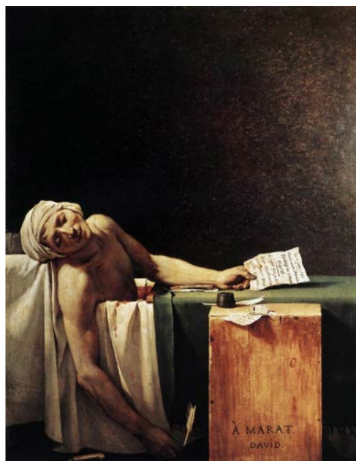
Рисунок 7. Жак Луи Давид. «Смерть Марата».

Х., м. 200x100 см. 1987. Частная коллекция.