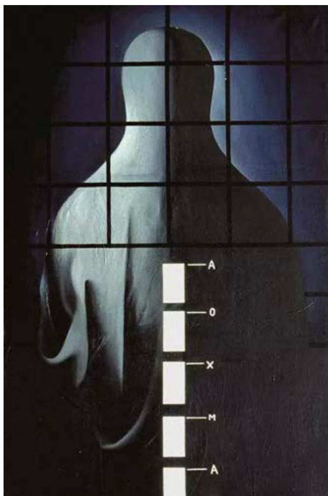
Рисунок 9. Ван Гуанъи. «Чёрная рациональность – священная пропорция». Х., м. 150x110 см. 1987. Галерея Компании экономического развития г. Чэнду.

Ван Гуанъи, максимально избавляясь от набора художественных средств реалистической живописи, покрыл краской и цифрами большую площадь плоского холста. Художник уходит от традиционного стиля, чтобы интуитивно отобразить восприятие реальности и современной истории. Он использует узнаваемые образы и символы, которые не только оказывают прямое визуальное воздействие, но и воспринимаются зрителем. Главным достижением поп-арта Ван