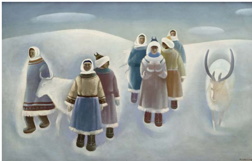
Рисунок 1. Ван Гуанъи. «Снег».

Х., м. 117х187 см. 1984. Галерея Китайской академии искусств.