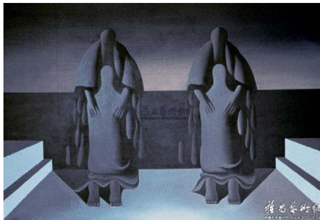
Рисунок 4. Ван Гуанъи. «Возвращение милосердной любви». Х., м. 119x185 см. 1986. Частная коллекция.

На картине «Замёрзший Северный полюс 30» (Рисунок 3) многократно скомпонованы однородные фигуры, упрощённые до конусообразной формы. Монуменальность форм придаёт торжественность композиции, применение метода жёсткого бокового освещения с высокой контрастностью позволяет минимизировать полутона и акцентировать геометрическую структуру форм. Концентрация света на голове и плечах фигур при одновременном погружении остальных объёмов в глубокую тень создаёт чёткие