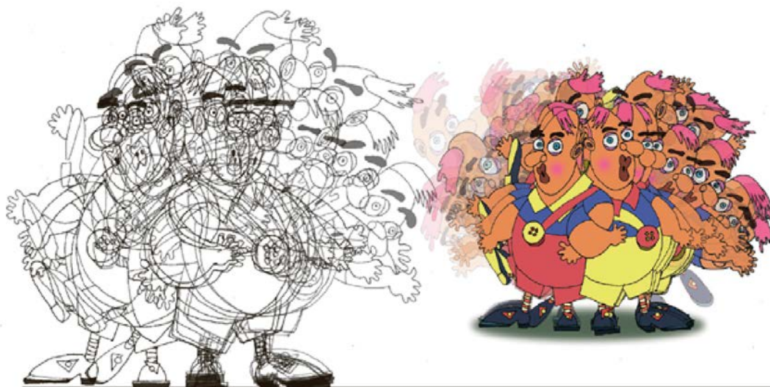
Рисунок 5. Работа студента по дисциплине «Анимация, покадровая отрисовка персонажа», Рук. проф. Куликов В.М.

скетчинг 4 , латтеринг 5 , проектные концепции, шрифт и цифровые технологии (Рисунок 5). Ключевые методические установки включали создание условий для авторских педагогических разработок, интеграцию цифровых и компьютерных технологий в учебный процесс, погружение студентов в актуальную профессиональную практику, а также развитие навыков