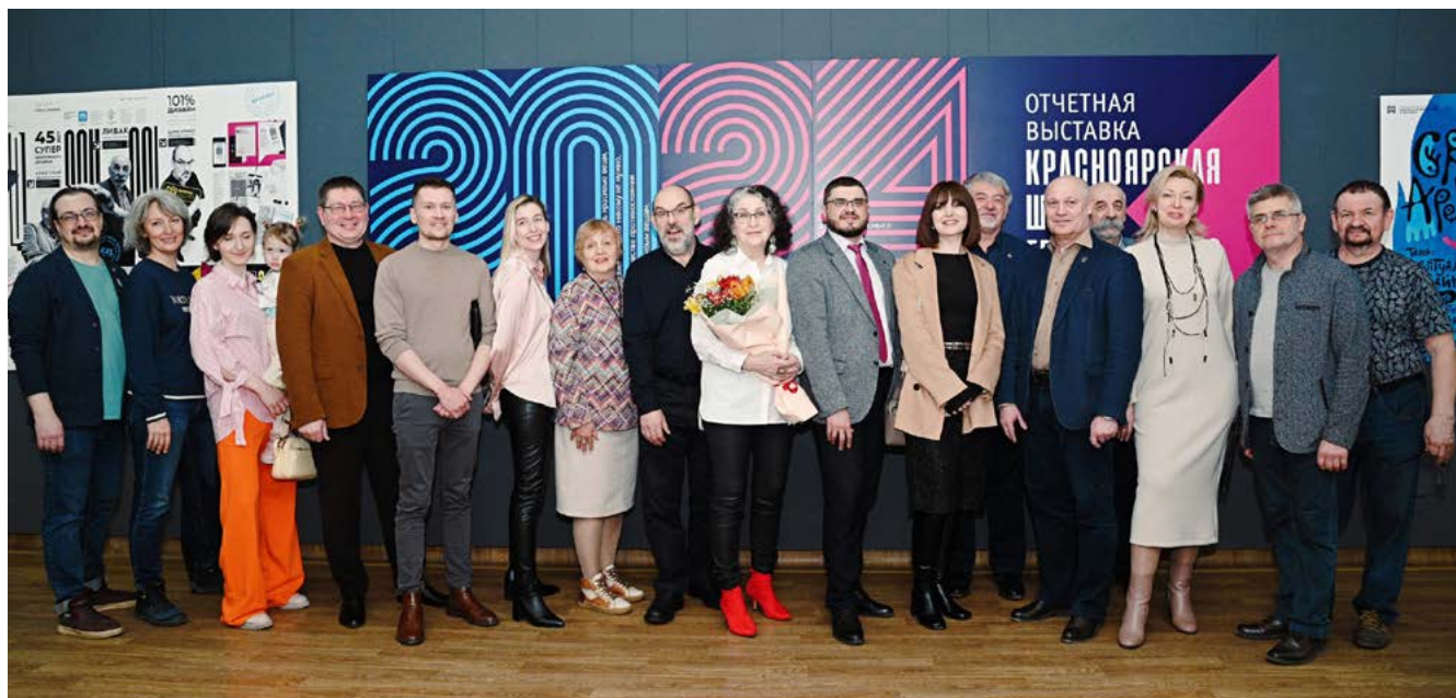
Рисунок 6. Отчетная выставка «Красноярской школы графического дизайна» 2024

образования – формирование и стандартизацию специализированного языка. Эффективная коммуникация внутри профессионального сообщества, равно как и в образовательной среде, невозможна без единого понятийного аппарата. В этом контексте словарь выступил важным инструментом систематизации знаний и структурирования учебного процесса.