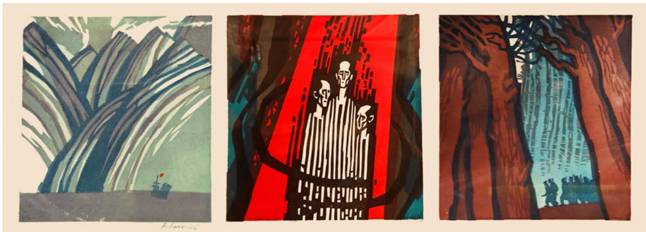
Рисунок 2. В.М. Куликов. Дипломная работа: три открытки из серии сувенирных открыток-песен о Великой Отечественной войне – «Помнит мир спасённый», заказчик издательство «Плакат» ЦК КПСС, МВХПУ, 1987 г., руководители: Родионова С.М., Волошко В.М.