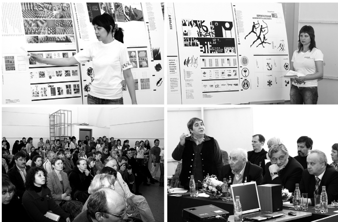
Рисунок 4. Фото с защиты дипломных проектов 2009 г.

не только формированию визуальной идентичности территории, но и осмыслению её культурной и социальной значимости.