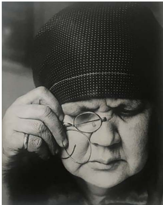
Рисунок 3. А.М. Родченко. Портрет матери, (1924)

Композиционно снимок решён через профильный ракурс. Профиль, отсылая к классической традиции, в модернистском контексте функционирует как приём схематизации и рационализации: исключая фронтальную «контактность» со зрителем, А. Родченко переносит акцент на контур, плоскости