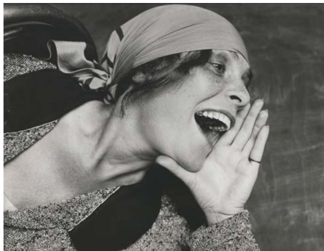
Рисунок 2. А.М. Родченко. Л.Ю. Брик в мастерской А.Родченко, (1924)

Данная работа принципиально дистанцируется от эстетических целей дореволюционных портретов. Здесь нет задачи подчеркнуть привлекательность или индивидуальность. Напротив, профильность и удвоение минимизируют мимику и переводят внимание к структуре: линии, ритму, соотношению плоскостей. Женский образ собирается через признаки