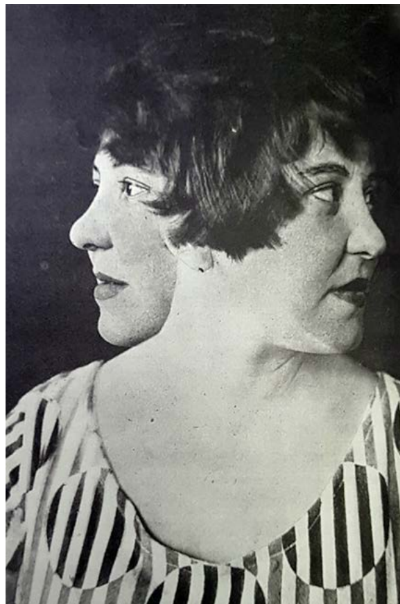
Рисунок 1. А.М. Родченко. В.Ф. Степанова. Двойной портрет, (1925)

Если в публичной визуальности 1920–1930-х годов образ «новой женщины» чаще формируется в логике проекта социальной роли и предъясняется через типизацию, то в портретной фотографии А. Родченко он становится полем тонкой настройки между личным и общим. Камера фиксирует не только психологические черты или внешность, но и формы повседневного действия, где проявляется культурная трансформация эпохи. Здесь особенно важны серийность и принцип «обсматривания» [5, с. 38], позволяющие переводить близкий объект в последовательность наблюдений; крупность и фрагментация делают лицо и фактуру носителями смысла; свет как средство не столько «героизации», сколько идейной концентрации; профильность как способ дисциплинировать образ и одновременно подчеркнуть достоинство