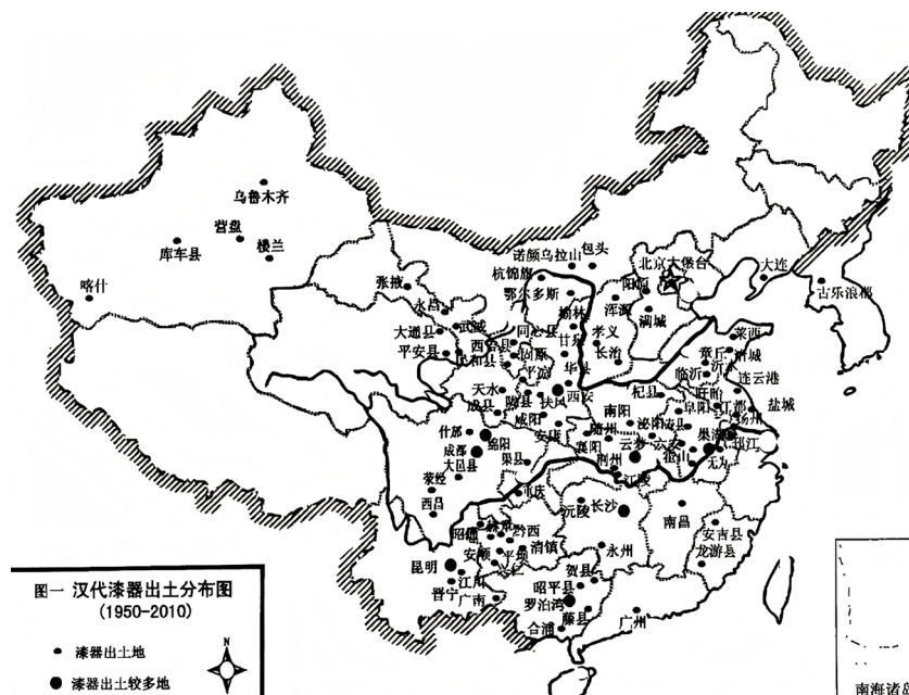
Рисунок 1. Карта раскопанных лаковых изделий династии Хань

и не поддающаяся деформации лаковая посуда из льняного полотна. Лаковое мастерство периода Воюющих царств заложило прочную основу для процветания лакового искусства династии Хань, а также указало направление развития лакового искусства в феодальном обществе.