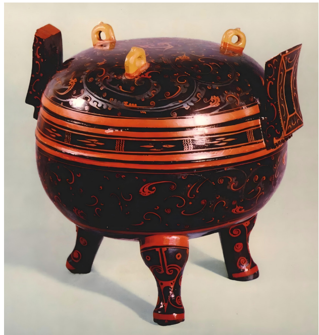
Рисунок 4. Дин – треножник. Обнаружен в гробнице Хань № 1 в Мавандуе, Чанша, в 1972 г. Высота 28 см, диаметр 23 см. Музей провинции Хунань.

Дальнейший расцвет техники изготовления китайской лаковой посуды связан с расширением ассортимента лакированной посуды, которая приобретает новые формы. Распространёнными становятся лаковые туеса и лаковые шкатулки прямоугольной, квадратной, овальной, круглой и подковообразной форм; создаётся множество небольших чашечек, тарелок и чаш с латунными