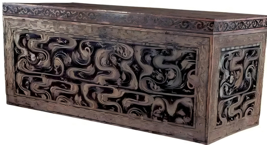
Рисунок 5. Лакированный гроб. Династия Западная Хань (202 г. до н.э. – 8 г.н.э.). Длина 256 см, ширина 118 см, высота 114 см. Обнаружен в ханьской гробнице № 1 в Мавандуе, Чанша, в 1972 г. Музей провинции Хунань.

что лаковое мастерство династии Хань достигло своего высочайшего пика развития художественного мастерства благодаря наследию превосходных технологий изготовления лака и методов управления производством во времена царства Чу, Воюющих царств и династий Цинь. Влияние лакового искусства династии Хань, ставшего образцом китайской культуры, подтверждается масштабами археологических находок изделий на территории КНР. История становления лаковой посуды прослеживается благодаря древним литературным источникам Сыма Цяня, Хуан Чэна о процессе изготовления,