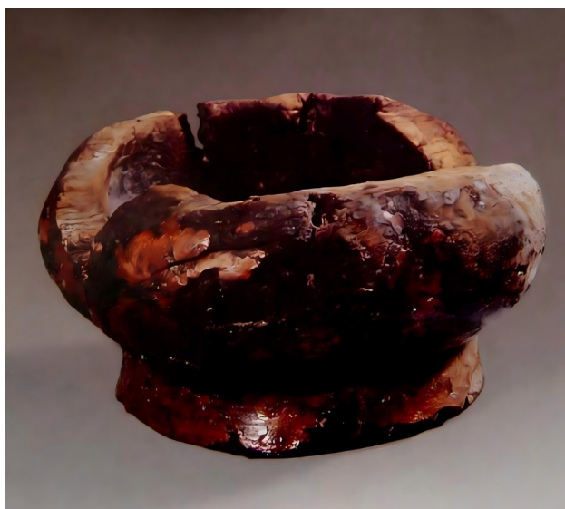
Рисунок 3. Красная лакированная деревянная чаша. Обнаружена в 1977 г. на участке T231 Хэмуду. Диаметр 10,6×9,2, высота 5,7, диаметр дна 7,6×7,2 см. Музей провинции Чжэцзян.

Лаковые изделия династии Хань были выявлены японскими учёными в округе Гулеранг (Корея) в XIX в. Среди первых открытий японских археологов в 1990-х гг. в Китае – гробницы Хань в Бэйшачэне, Хуайане, Хэбэе и в древнем замке Янгао в Шаньси. Учёные КНР впервые исследовали гробницы Хань,