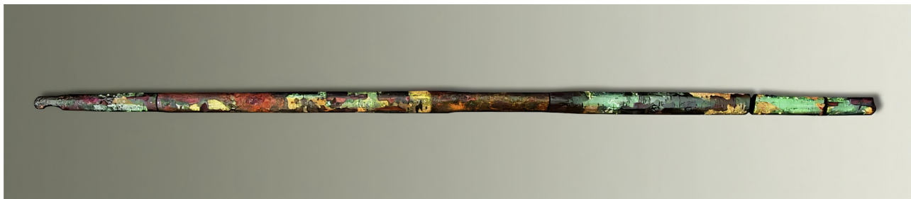
Рисунок 2. Метательное оружие – деревянный лаковый лук. Обнаружен в 2002 г. Длина 121 см, ширина 3 см. Музей Сяошань провинции Чжэцзян.

оружия, канцелярских принадлежностей до погребальной утвари. В этот период лаковые изделия использовались по всему юго-востоку и северо-западу Китая. Во времена династии Западная Хань (202 г. до н. э. – 8 г. н. э.) китайская лаковая посуда начала распространяться в соседние регионы, такие как Корея, Япония и Юго-Восточная Азия, внося выдающийся вклад в мировую культуру.